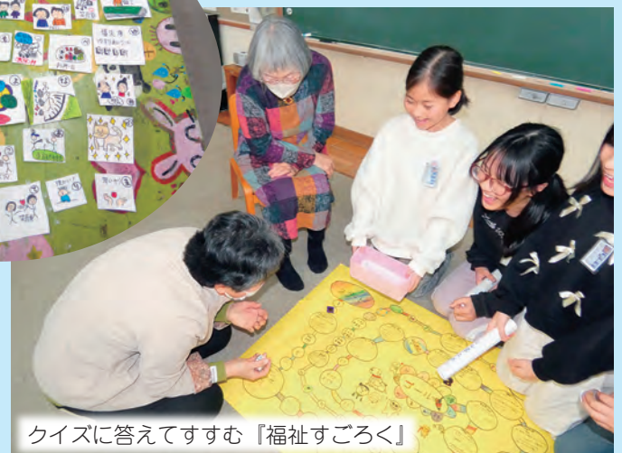
クイズに答えてすすむ『福祉すごろく』