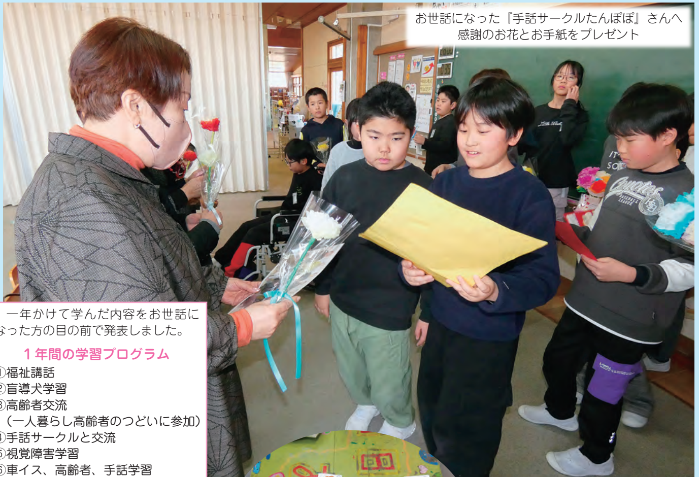
お世話になった『手話サークルたんぽぽ』さんへ 感謝のお花とお手紙をプレゼント