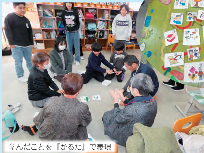
学んだことを『かるた』で表現