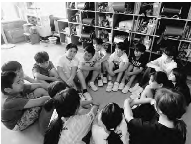
▲1回目の授業。「福祉」ってなんだろう？